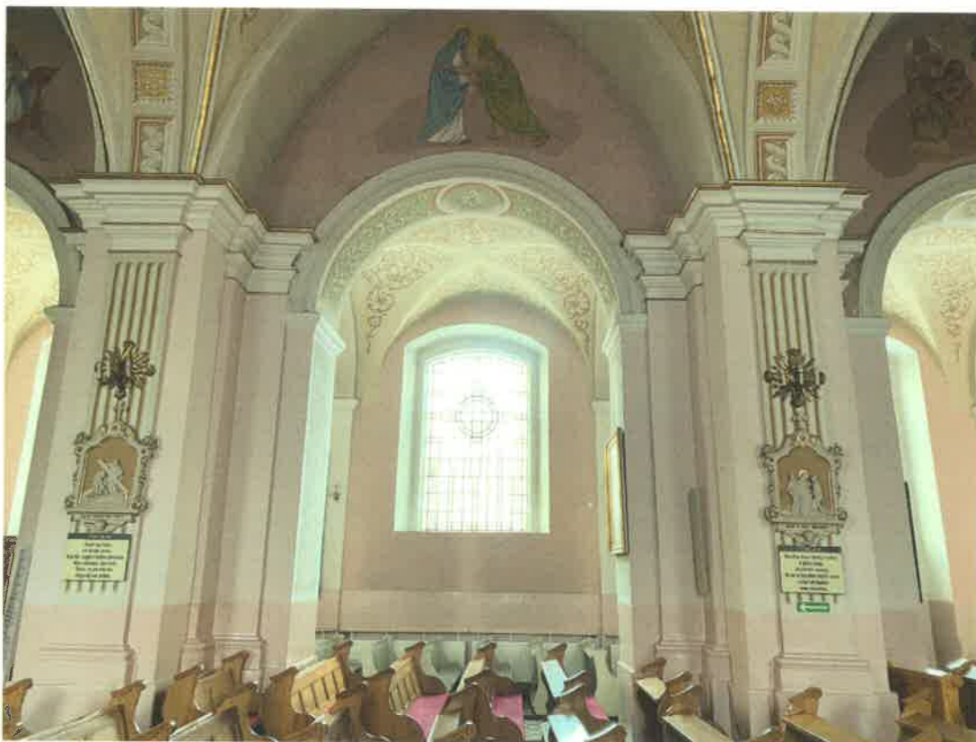
Fot. 7. Widok z nawy głównej na nawę północną.