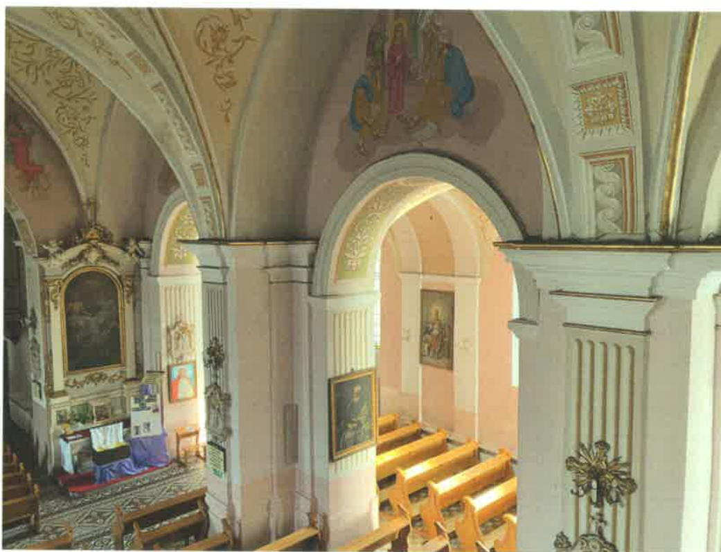
Fot. 16. Fragment ściany północnej nawy głównej - widoczne zabrudzenia, spękania malowideł i tynków.