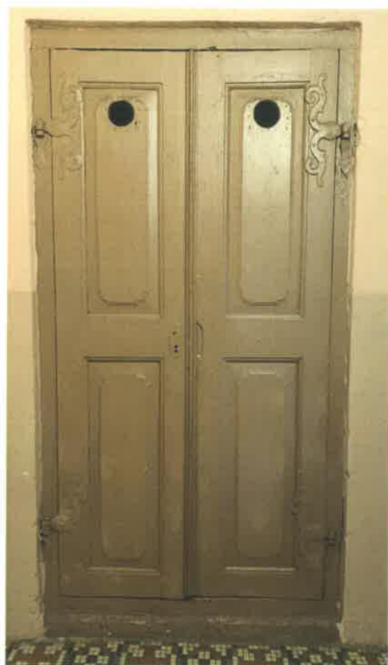
Fot. 19, 20, 21, 22. Oryginalna stolarka drzwiowa.