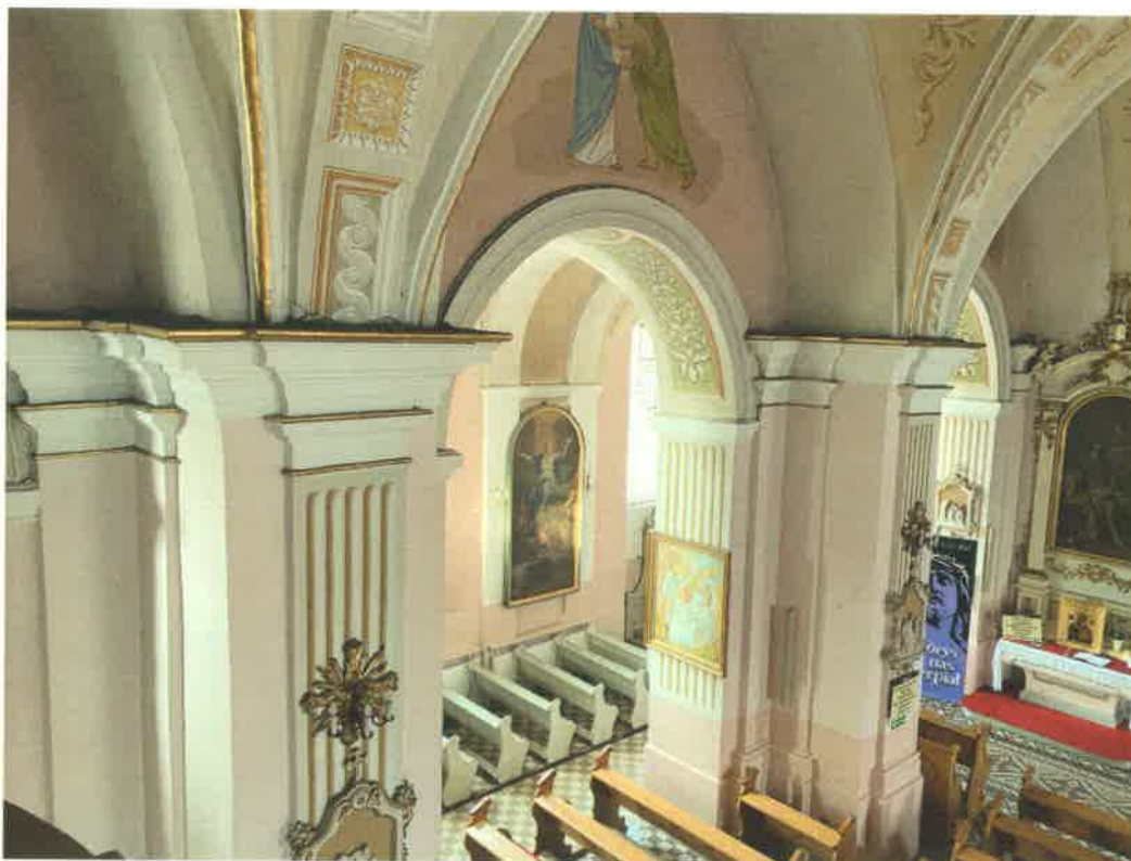
Fot. 15. Fragment ściany północnej nawy głównej - widoczne zabrudzenia, spękania malowideł i tynków.