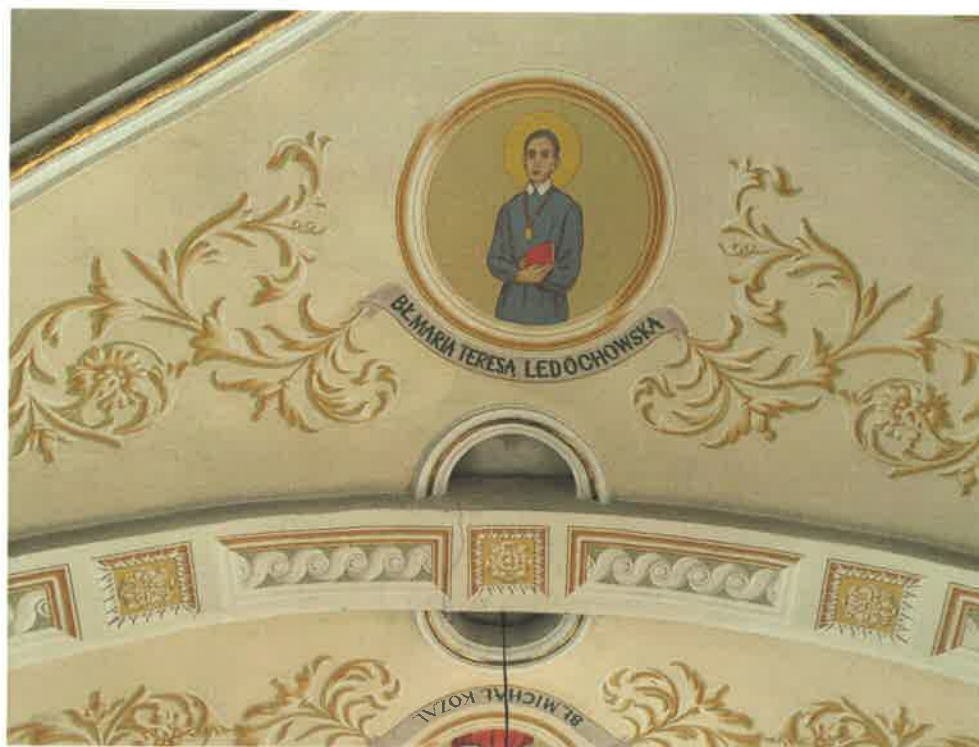
Fot. 17. Fragment sklepienia nawy głównej - widoczna spudrowana warstwa malarska, spękania tynków, znaczne zabrudzenie powierzchniowe.