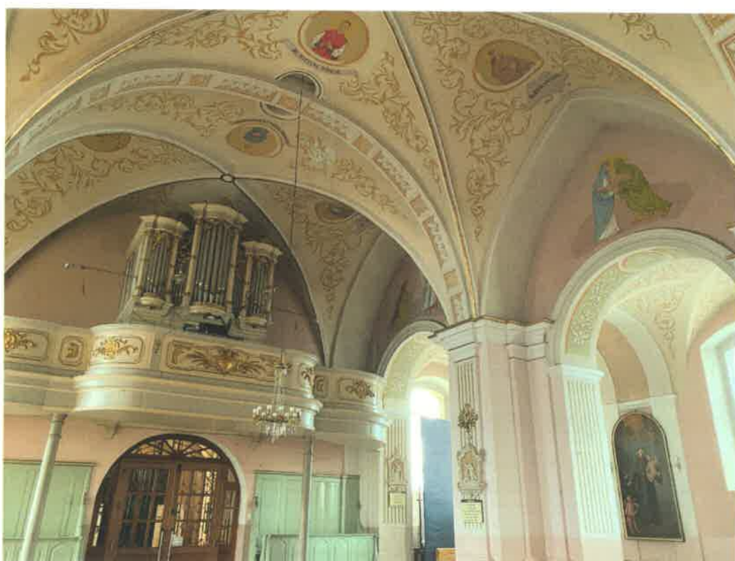
Fot. 6. Fragment nawy głównej świątyni.