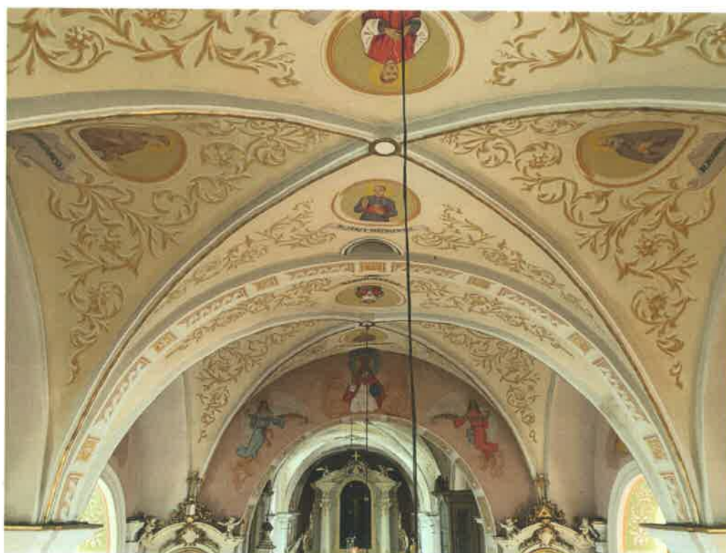
Fot. 18. Widok na sklepienie nawy głównej.