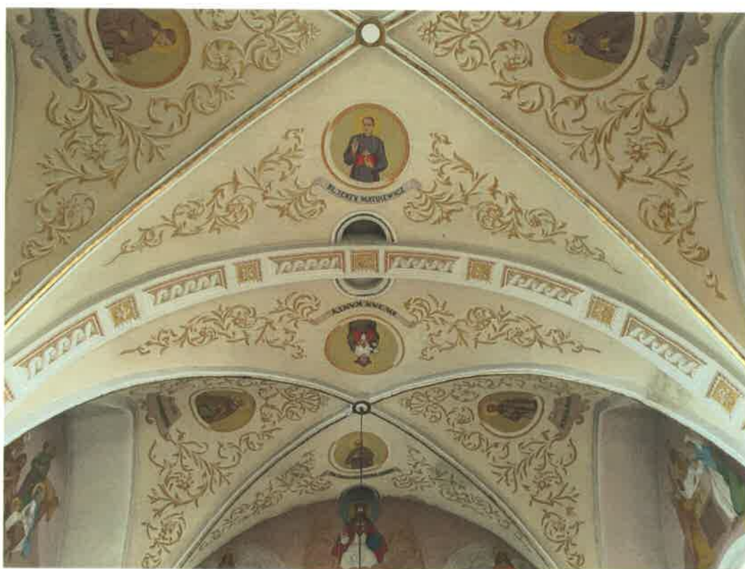
Fot. 10. Fragment sklepienia nawy głównej.