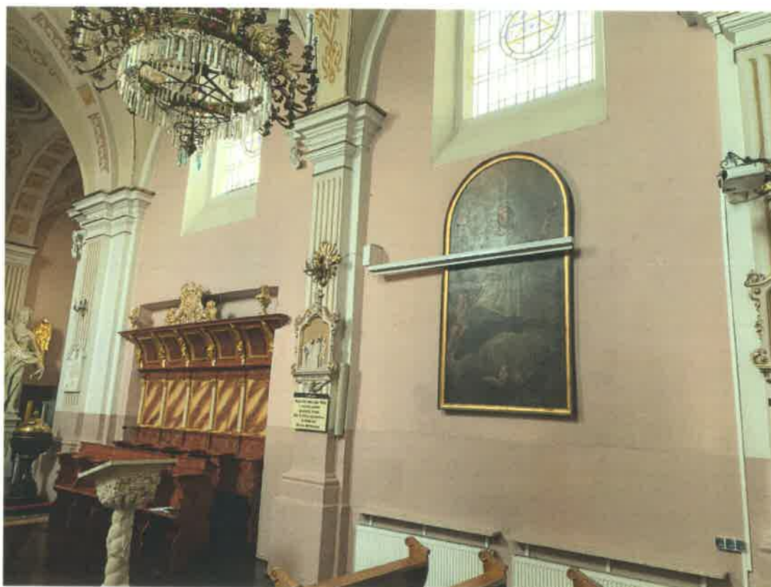
Fot. 4. Ściana południowa prezbiterium.