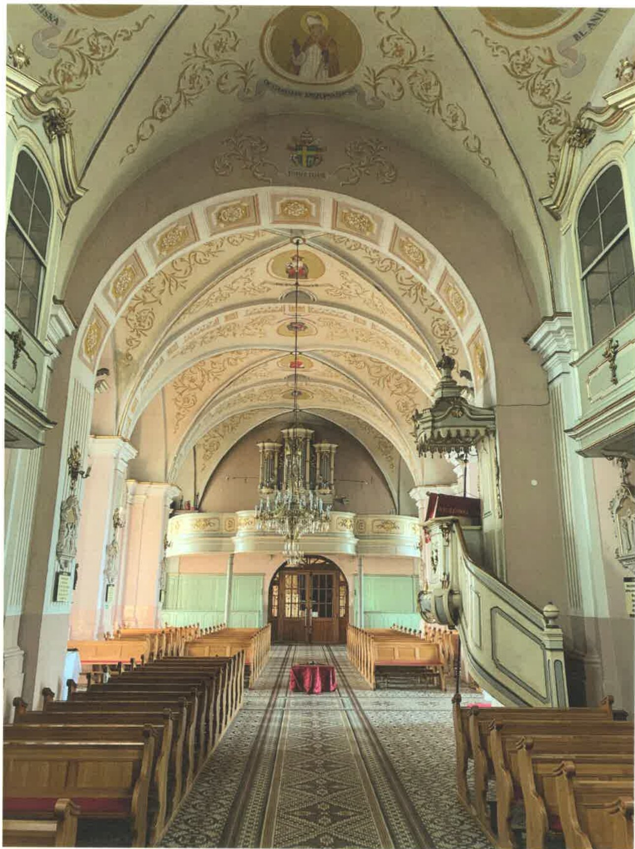
Fot. 2. Widok na wnętrze świątyni w stronę chóru.