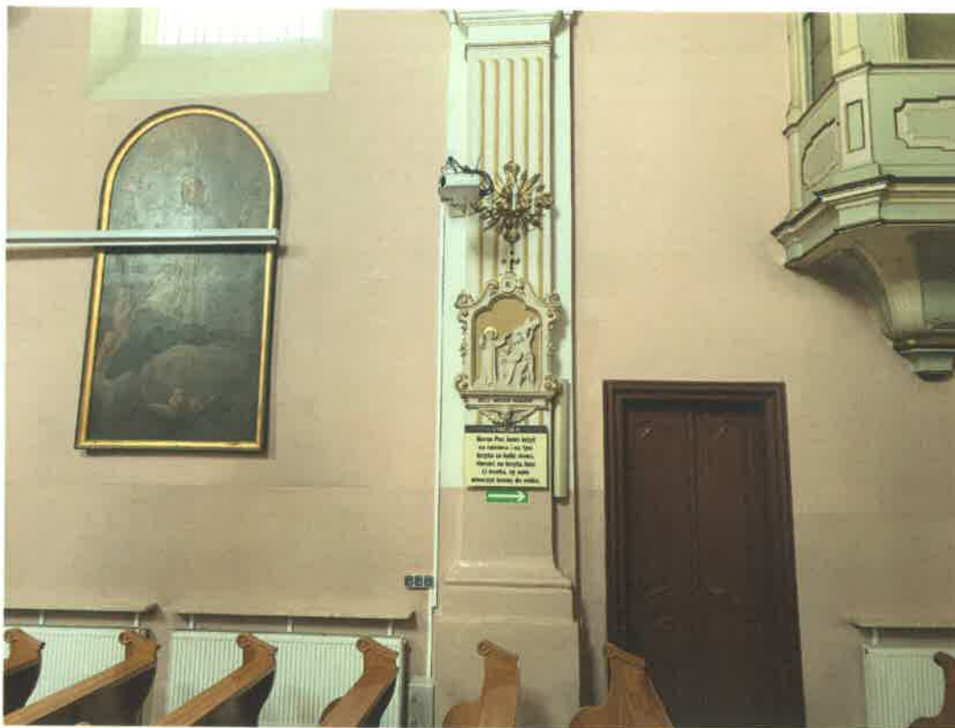
Fot. 5. Fragment ściany południowej prezbiterium.