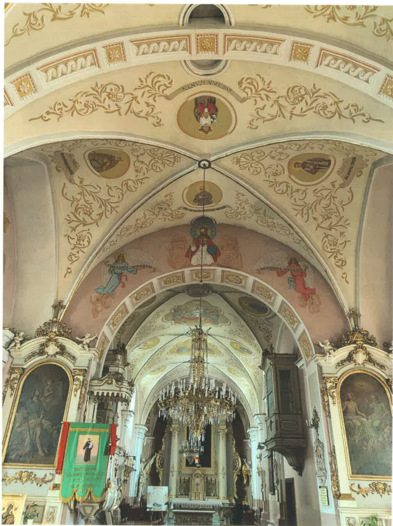
Fot. 11. Widok z nawy głównej - widoczne malowidła na łuku tęczowym.