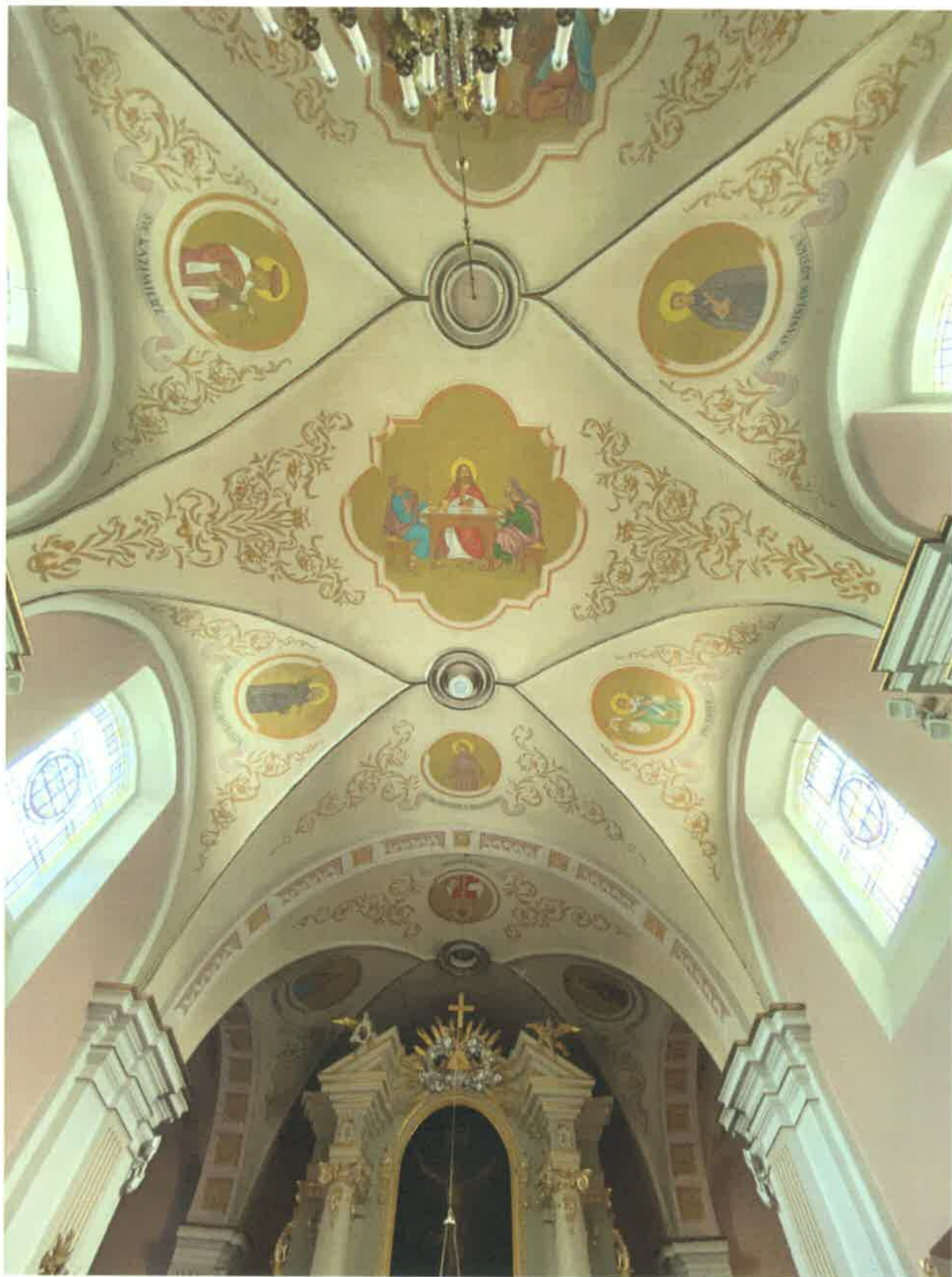
Fot. 1. Sklepienie prezbiterium.