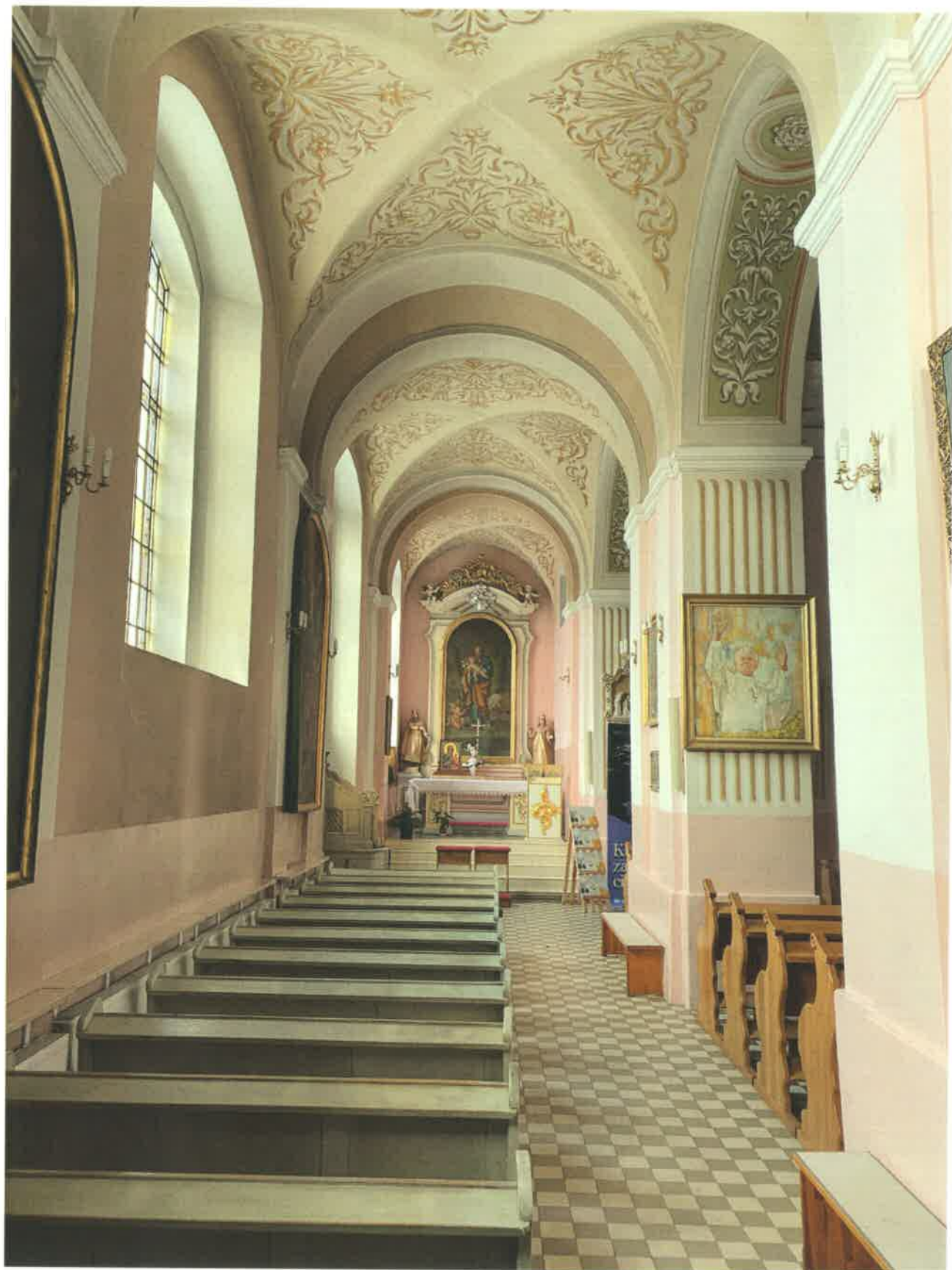
Fot. 12. Widok na nawę północną.