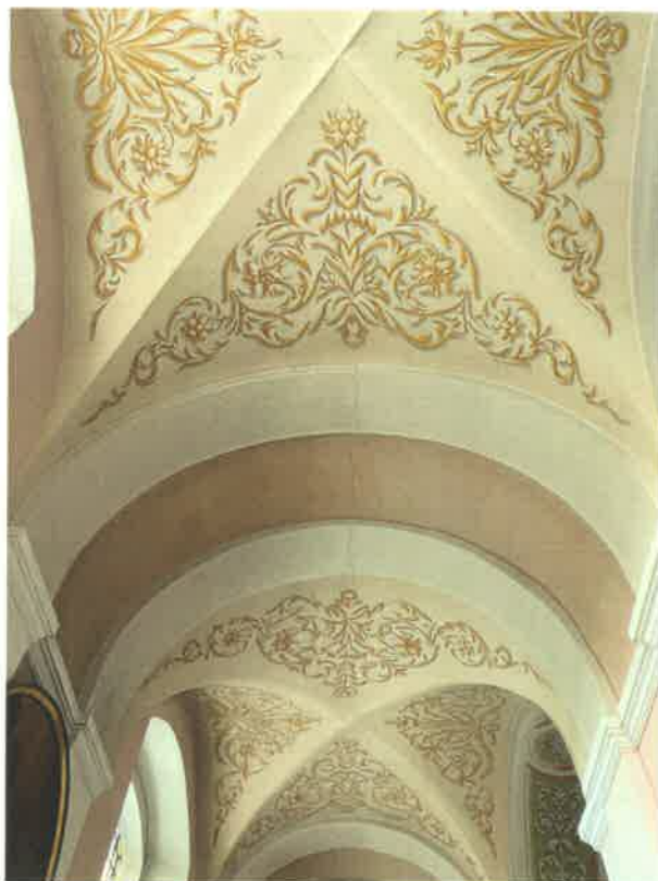
Fot. 13. Sklepienia nawy północnej - widoczne spękania tynków.