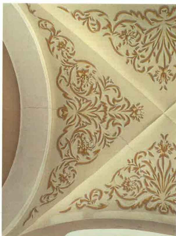
Fot. 14. Sklepienia nawy południowej - widoczne spękania tynków, silne zabrudzenie malowideł.