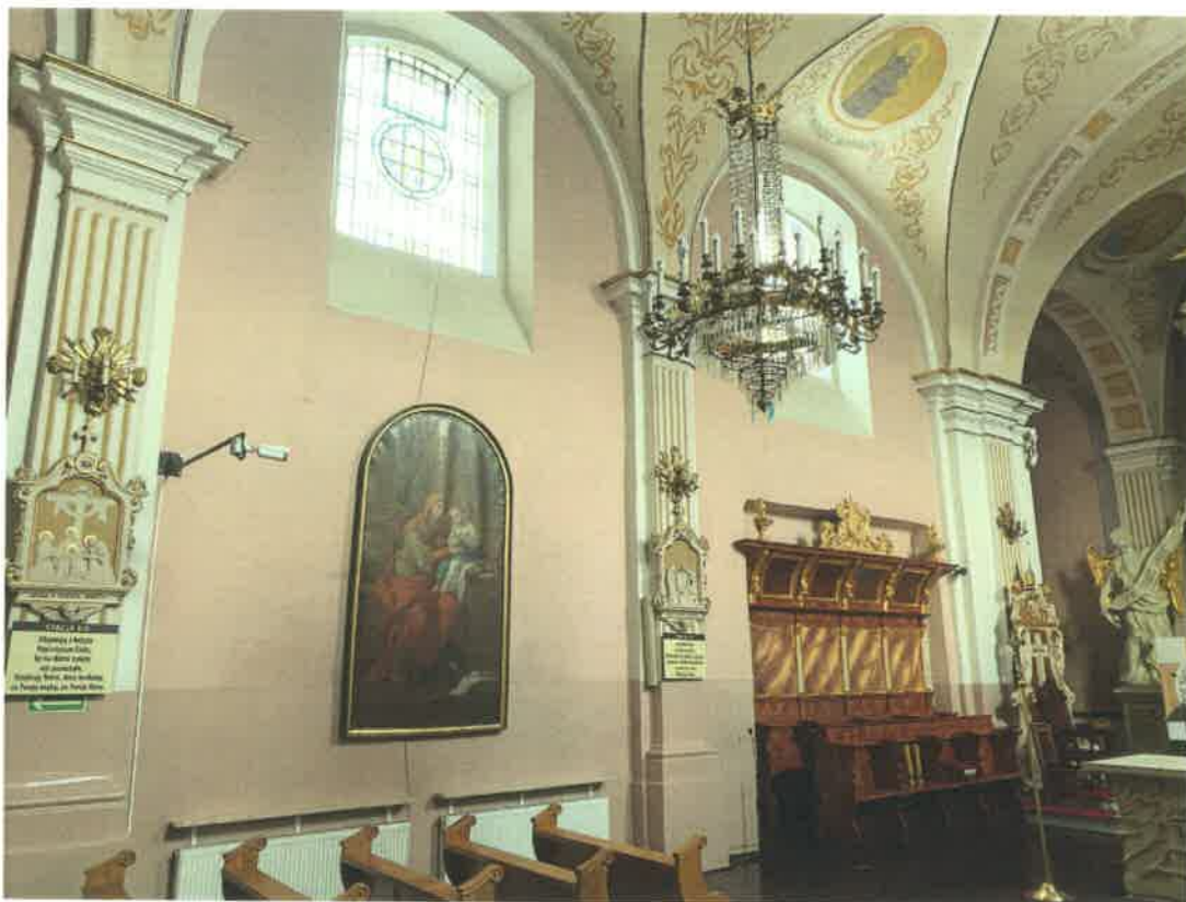
Fot. 3. Ściana północna prezbiterium.